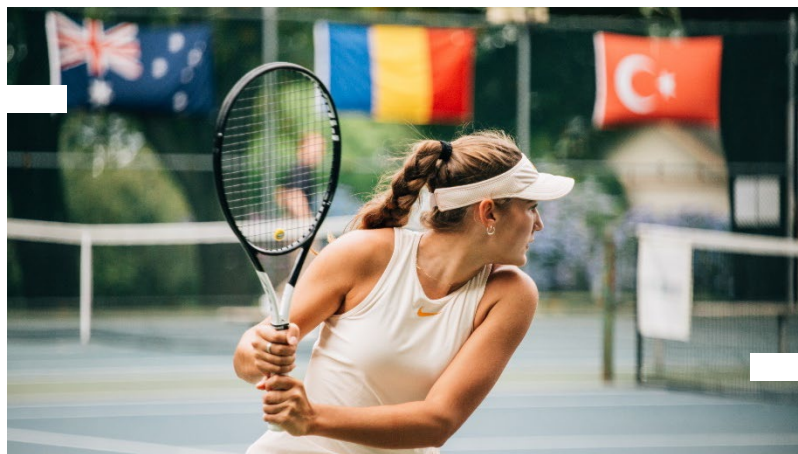
TOURNOIS JUNIORS ITF