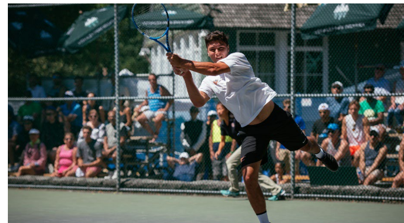
TOURNOIS OPEN 1000